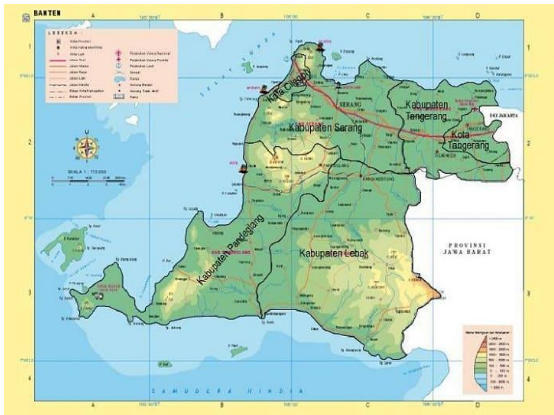
Gambar 1.1. Peta Provinsi Banten

Dalam rangka menjalankan ketentuan Pasal 46 Undang-Undang Nomor 48 Tahun 2009 tentang Kekuasaan Kehakiman dan dalam rangka memberikan dukungan di bidang teknis dan administrasi perkara maka Mahkamah Agung RI menetapkan Peraturan Mahkamah Agung tentang Organisasi dan Tata Kerja Kepaniteraan dan Kesekretariatan Peradilan Nomor 7 Tahun 2015 yang telah diubah menjadi Peraturan Mahkamah Agung Nomor 1 Tahun 2017. Berdasarkan PERMA tersebut dapat dijelaskan tugas dan fungsi masing-masing bagian sebagai berikut: