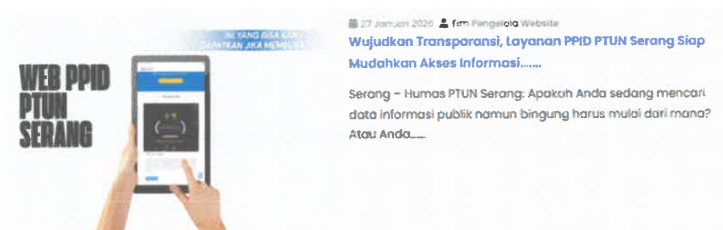
Gambar: Informasi publik yang diumumkan secara serta-merta

Daftar informasi publik yang diumumkan secara serta merta pada Pengadilan Tata Usaha Negara Serang adalah sebagai berikut: