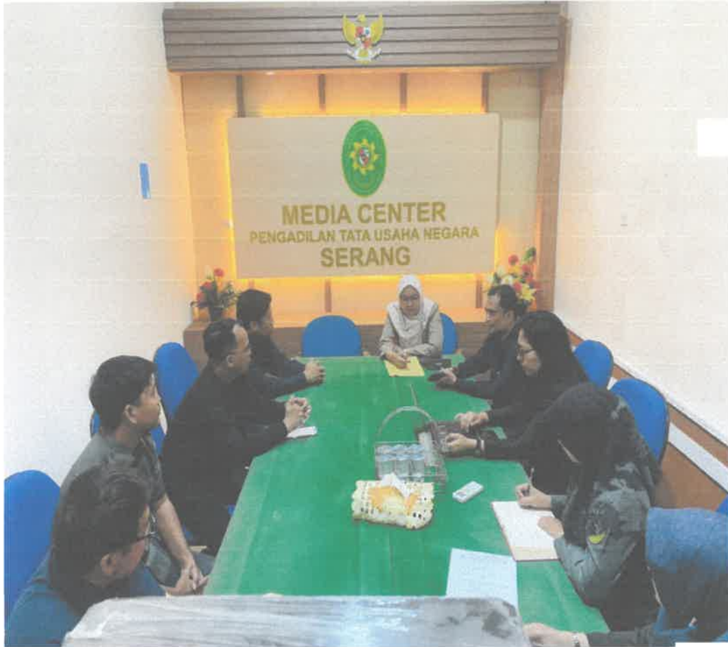
Foto Dokumentasi Monitoring dan Evaluasi PPID Triwulan ke-I Tahun 2026 Oleh Atasan PPID, PPID, Pelaksana PPID dan Petugas Layanan Informasi