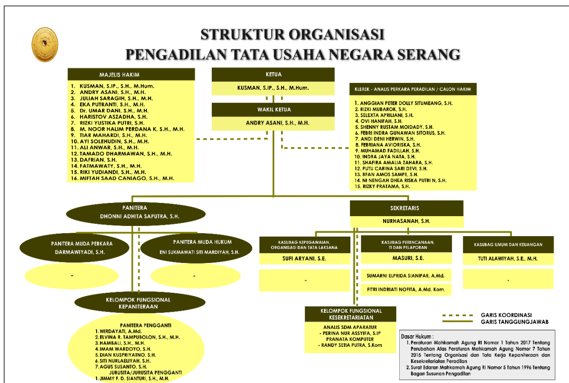
Gambar 1. Struktur Organisasi Pengadilan Tata Usaha Negara Serang