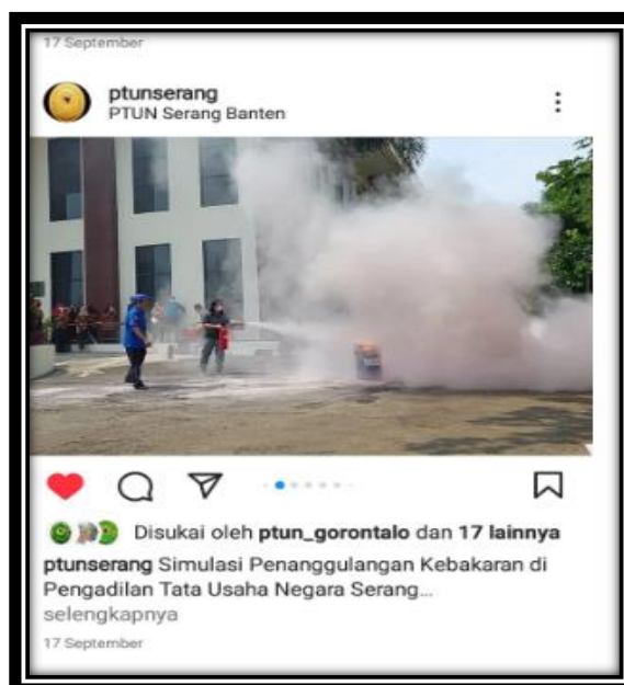
Gambar: Publikasi harian melalui media Whatsapp dan Instagram