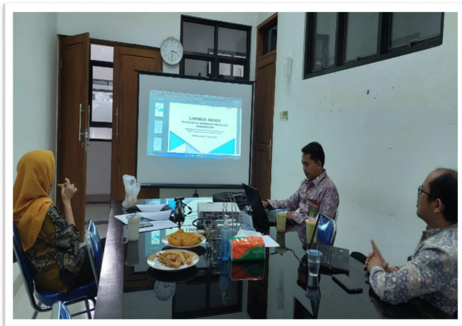
Foto Dokumentasi Monitoring dan Evaluasi PPID Triwulan ke-III Tahun 2022 Oleh Atasan PPID